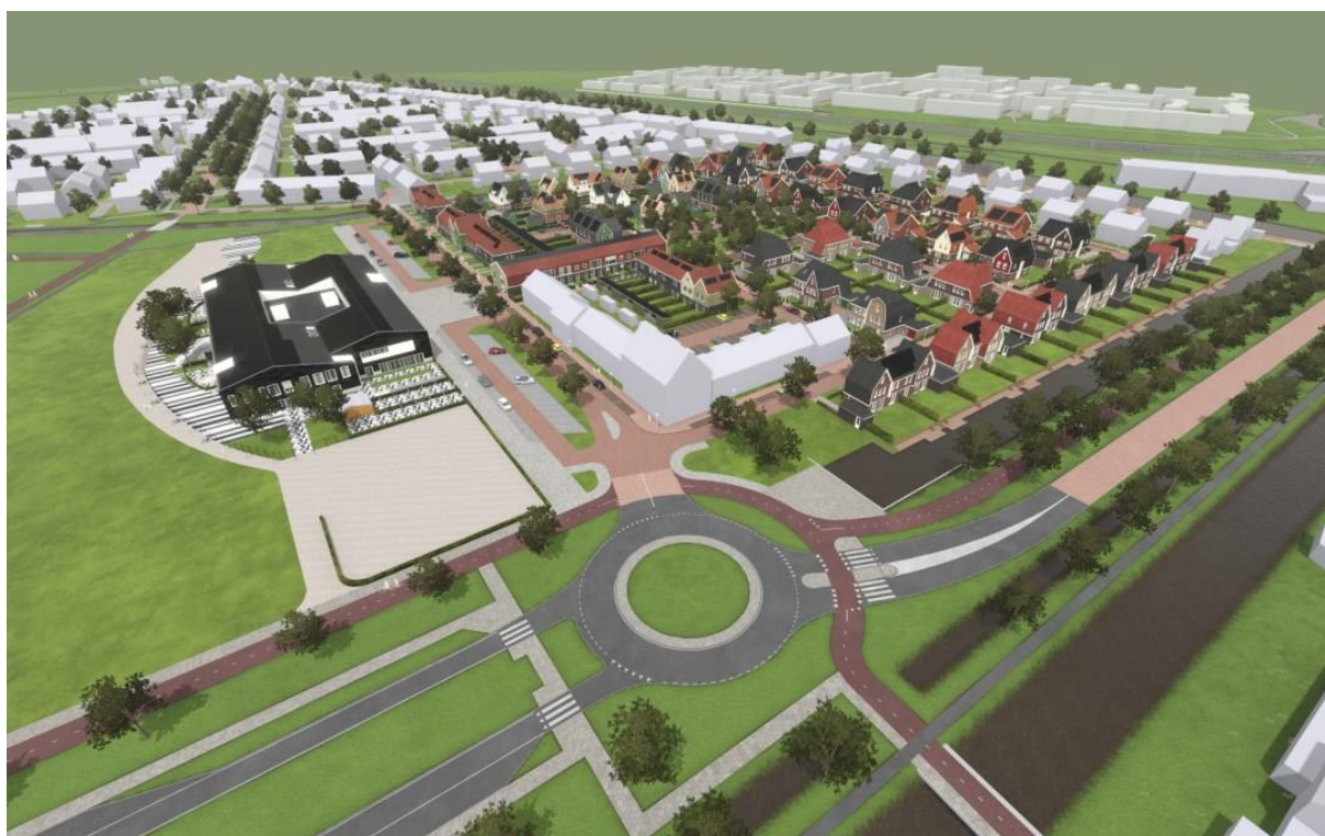
Het nieuwe schoolgebouw vanaf schooljaar 2018-2019